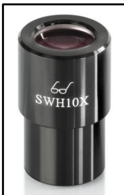
Oculaire high eye point (reconnaisable au symbole des lunettes)