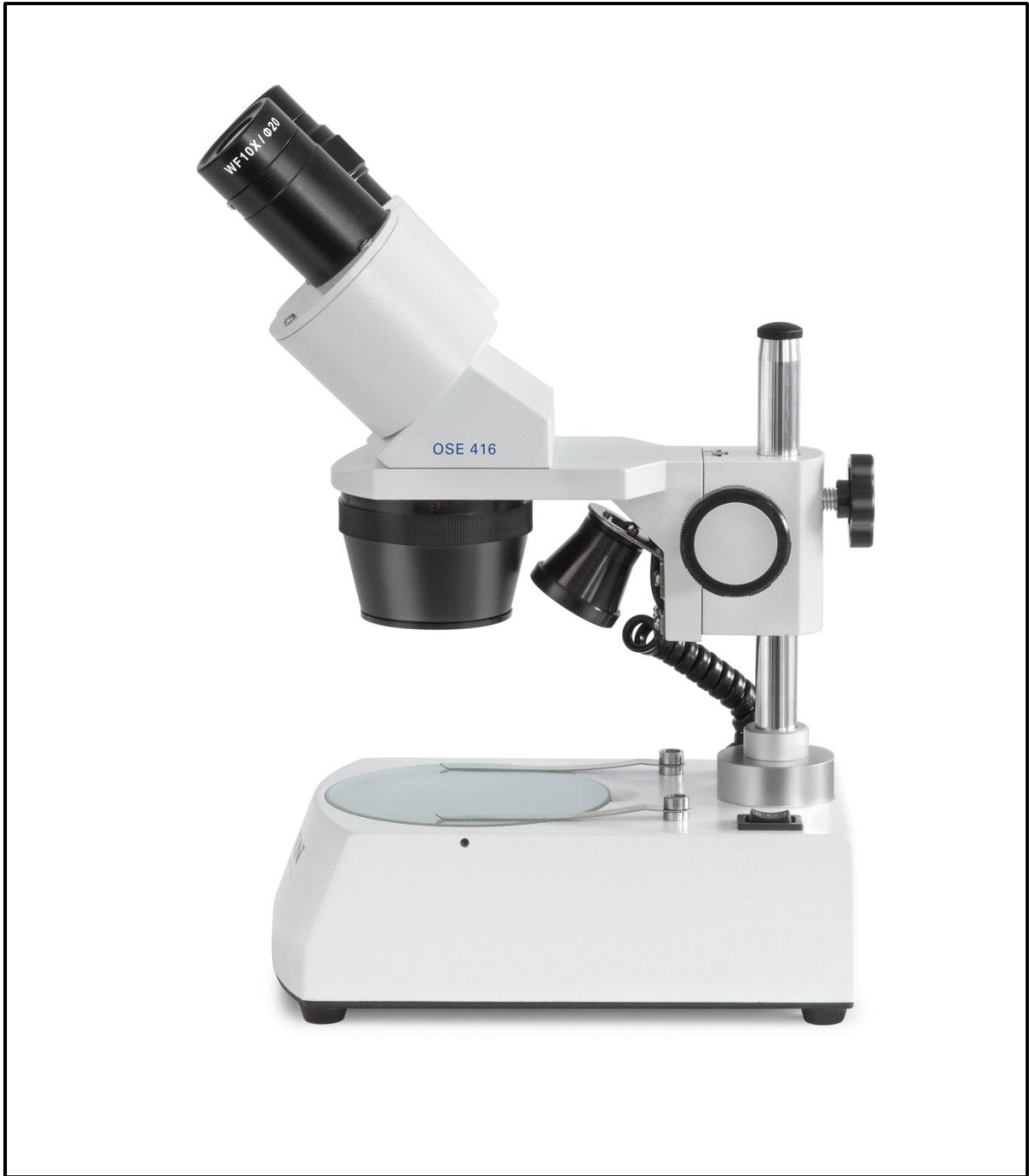
Microscope stéréo entièrement monté