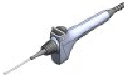
Position 2 (ca. 30 % höhere Saugleistung)