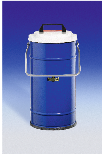
Dewargefäß 30/4 bis 32 C mit Tragebügel