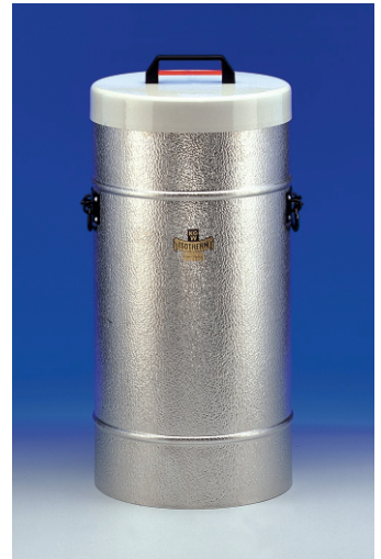
Dewargefäß 33 bis 34 CAL mit seitlichen Griffen