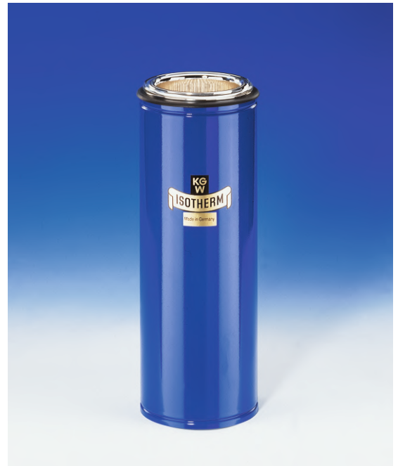
Dewargefaß Typ 9 C